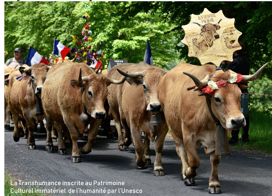
La Transhumance inscrite au Patrimoine Cultuel immatériel de l'humanité par l'Unesco