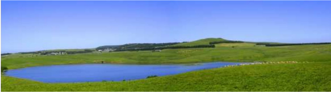
Lac des Moines