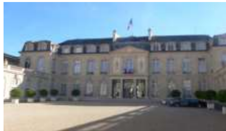
Palais de l'Élysée