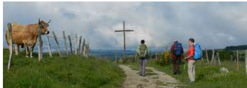
Randonneurs à Laguiole