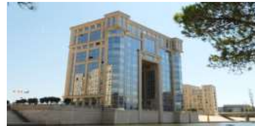
Conseil Régional Languedoc Roussillon