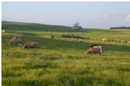
Estive sur le haut plateau ouvert de l'Aubrac