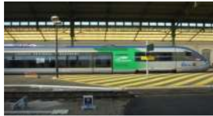
Train Ter Auvergne