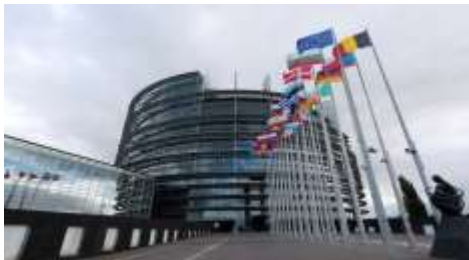
Siège UE à Bruxelles