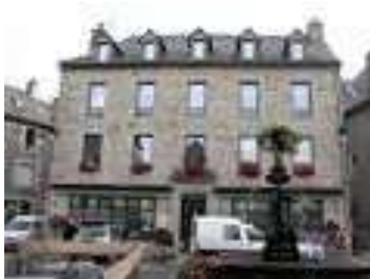
Mairie de Laguiole